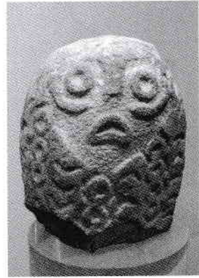
În stânga, reconstrucție a unei colibe, în dreapta, o sculptură (6300–5900 î.Hr.), ambele în Muzeul Lepenski Vir

monumentale executate în bolovani, care apar într-un mare număr de așezări, dar mai cu seamă la Lepenski Vir. Numeroasele sculpturi din această așezare au o iconografie sofisticată și recurentă. Aceste două elemente indică faptul că populația din Gorja a fost o comunitate care s-a dezvoltat pe o perioadă îndelungată (aproximativ 2 500 de ani) și a suferit schimbări interne în sfera economică, socială și simbolică.